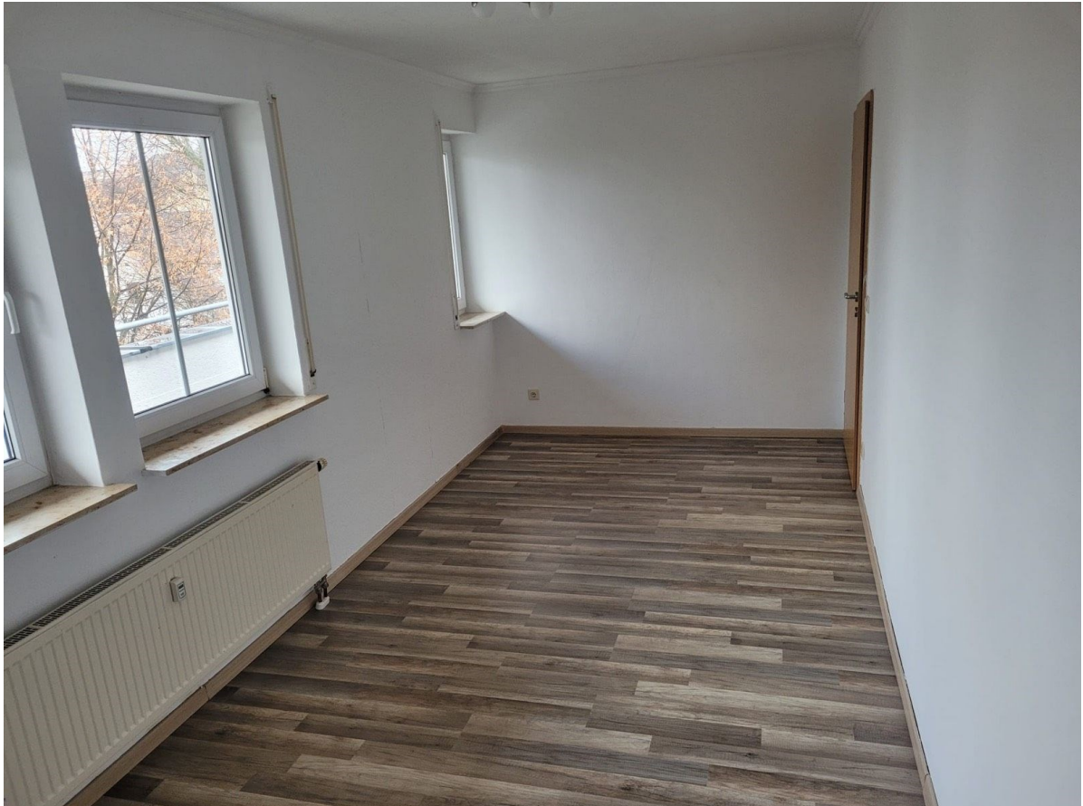
Wohnung - Ansicht Kinderzimmer 2