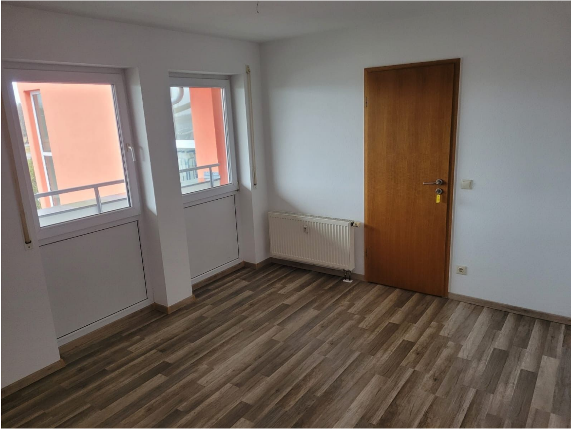
Wohnung - Ansicht Wohnzimmer