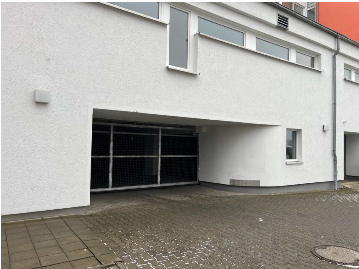
Gebäude - Einfahrt Tiefgarage