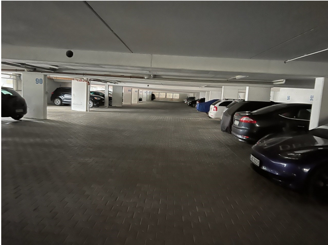
Gebäude - Ansicht Stellplatz (Tiefgarage)