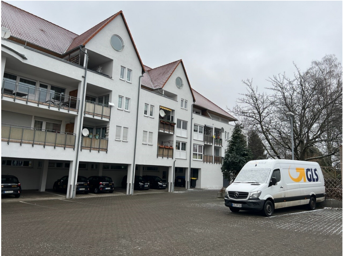
Gebäude - Frontansicht