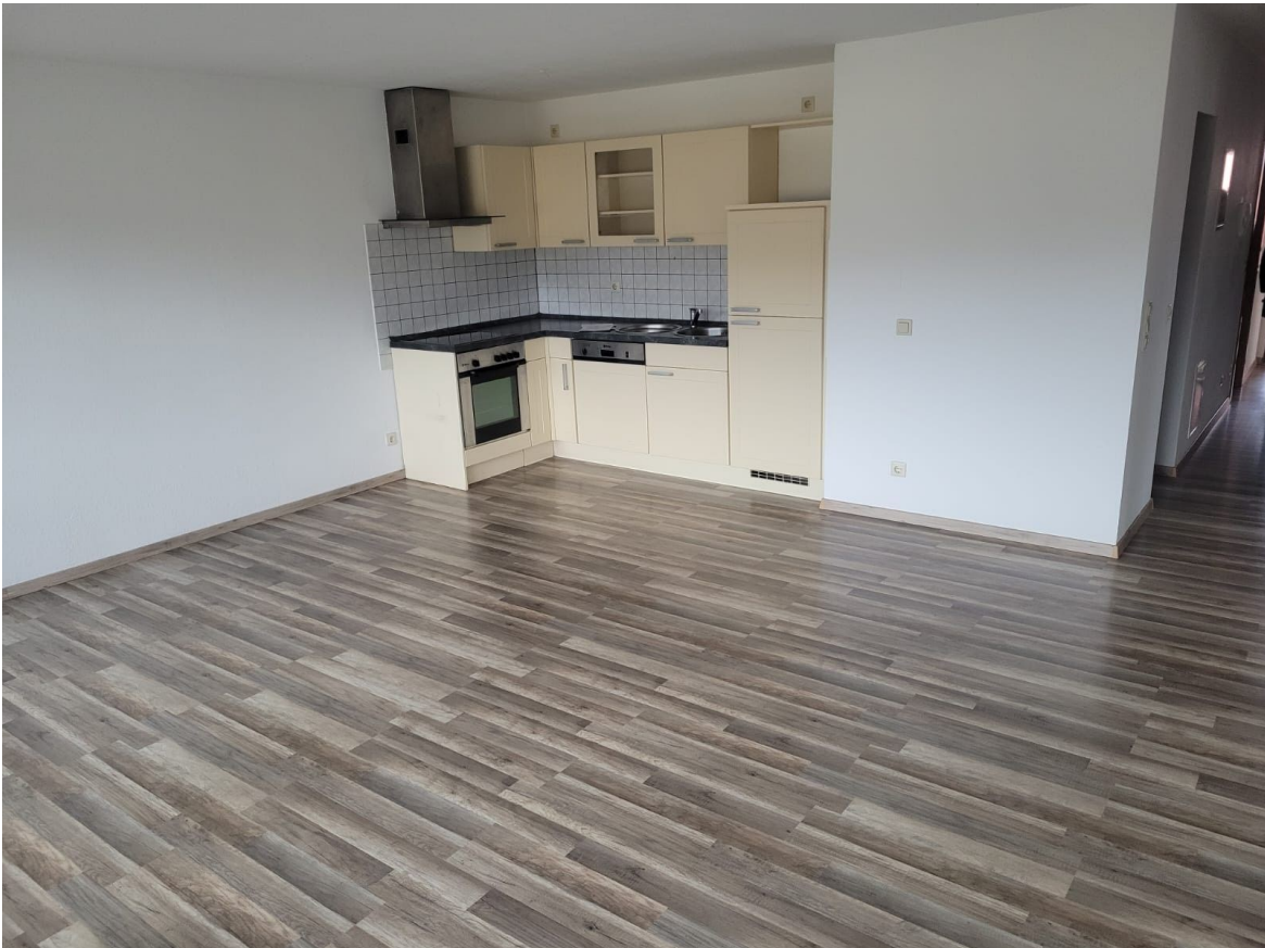
Wohnung - Ansicht Küchenzeile