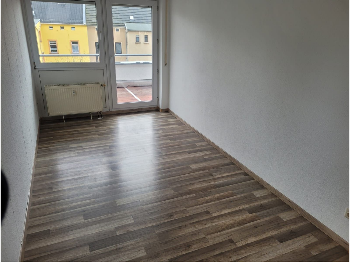
Wohnung - Ansicht Kinderzimmer 1