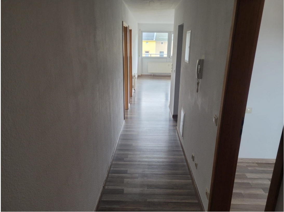
Wohnung - Ansicht Flur